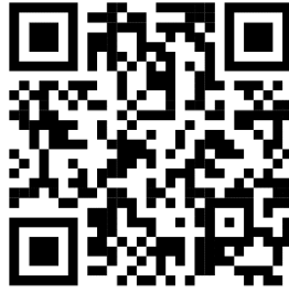
แผนปฏิบัติการประจำปี (QR code)