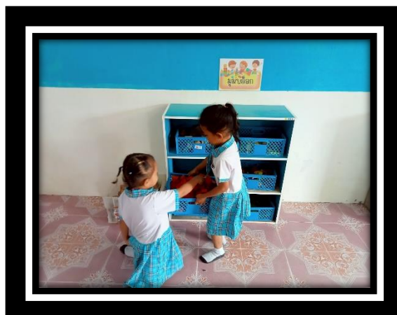
เด็กเก็บของเล่นเข้าที่อย่างเรียบร้อยด้วยตนเอง