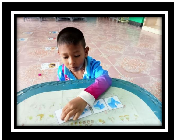
เด็กเรียงลำดับภาพตามขนาดจากเล็กไปหาใหญ่