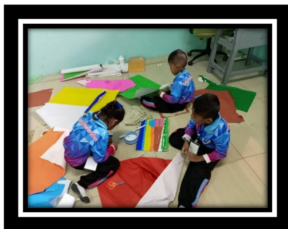
ตัวแทนนักเรียนชั้นอนุบาล ๓ โรงเรียนวัดเกษตรภิราม เข้าร่วมกิจกรรมการแข่งขันฉีก ตัด ปะ กระดาษ หัวข้อ โรงเรียนของฉัน งานศิลปหัตถกรรมนักเรียน ระดับศูนย์เครือข่ายมิตรภาพ