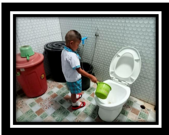
เด็กใช้ห้องน้ำห้องส้วมด้วยตนเองได้