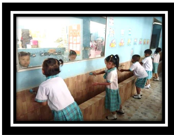
เด็กล้างมือก่อนรับประทานอาหารและ หลังจากใช้ห้องน้ำห้องส้วม