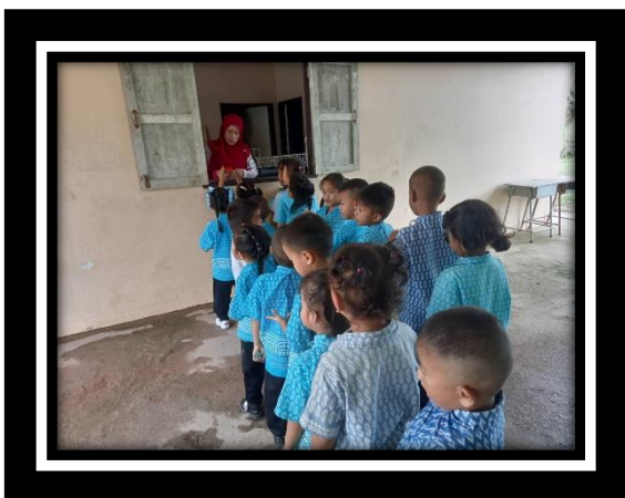
เด็กเข้าแถวตามลำดับการมาก่อนมาหลังในการซื้อขนม