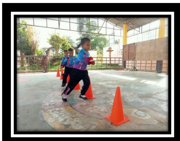
เด็กวิ่งหลบหลีกสิ่งกีดขวางได้