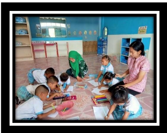
เด็กทำงานที่ได้รับมอบหมายจนสำเร็จ