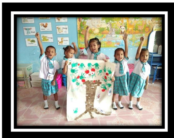
เด็กกล้าแสดงออกในการนำเสนอผลงาน