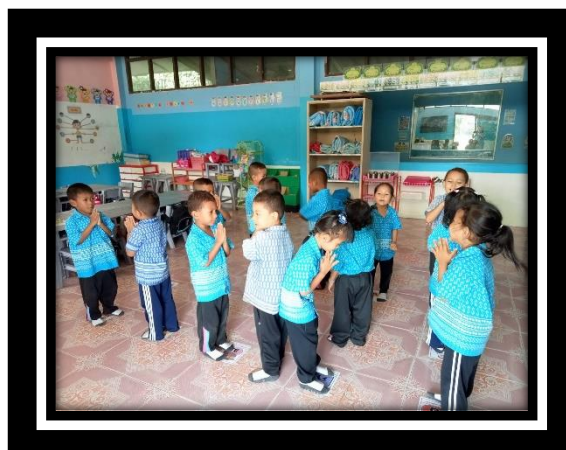
เด็กแสดงความรักต่อเพื่อน