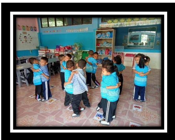
เด็กแสดงความรักต่อเพื่อน