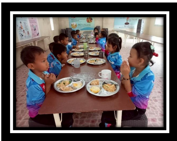
เด็กรับประทานอาหารที่มีประโยชน์