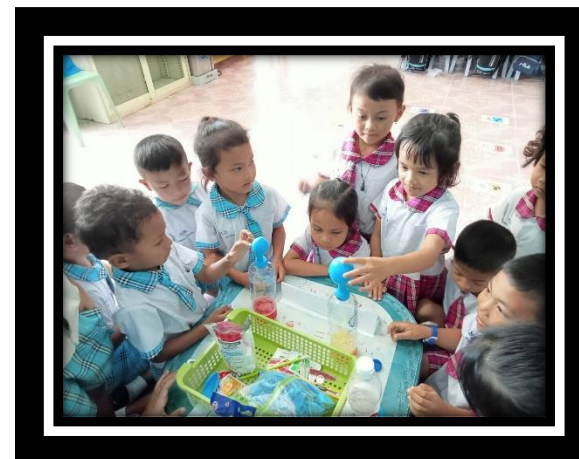
ลูกโป่งพองโต โดยการใส่เบกกิ้งโซดา ในขวดที่มีน้ำ นำลูกโป่งมาสวมที่ปากขวด แรงดันก๊าซทำให้ลูกโป่งพองโตขึ้นเรื่อยๆ