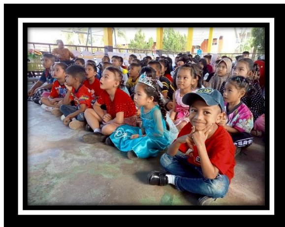
เด็กระดับอนุบาล ๒ - ๓ แสดงออกทางการเต้น ในวันปีใหม่ วันเด็ก ของโรงเรียน และของอบต.นานาค และ กิจกรรมเปิดพิธีการแข่งขันเต้นแอโรบิก