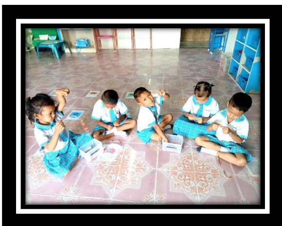
เด็กร้อยลูกปัดได้