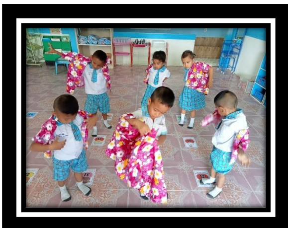
เด็กแต่งตัวด้วยตนเองได้