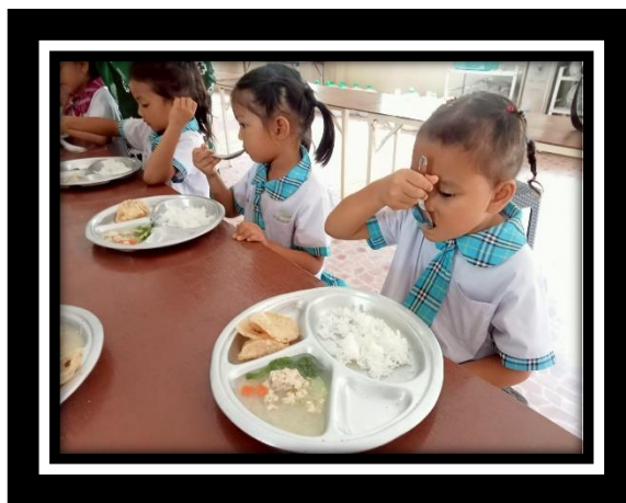
เด็กรับประทานอาหารด้วยตนเองได้