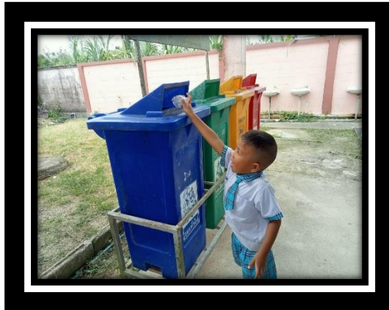
เด็กทิ้งขยะลงถังขยะได้ถูกต้องด้วยตนเอง