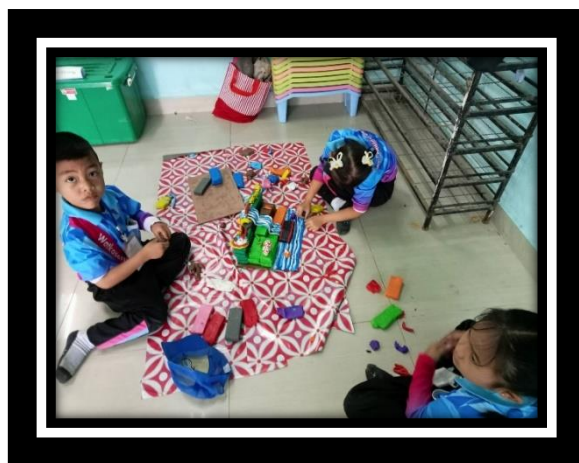
ตัวแทนนักเรียนชั้นอนุบาล ๓ โรงเรียนวัดเกษตรภิราม เข้าร่วมกิจกรรมการแข่งขันการปั้นดินน้ำมัน ในหัวข้อ สวนสัตว์ งานศิลปหัตถกรรมนักเรียน ระดับศูนย์เครือข่ายมิตรภาพ