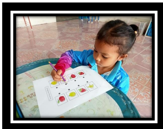
เด็กสามารถจับคู่ภาพผลไม้ชนิดเดียวกัน