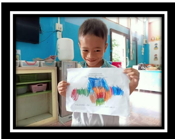
เด็กมีความสุข กับผลงานศิลปะของตนเอง