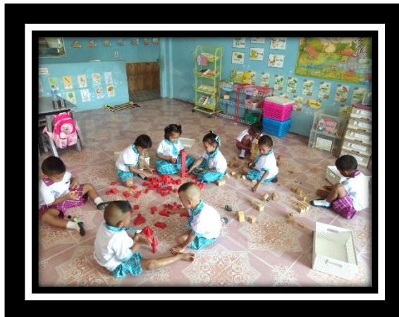
เด็กมีความสุข จากการร่วมเล่นกับเพื่อนๆ