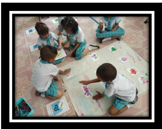
เด็กมีความกระตือรือร้นในการร่วมกิจกรรม