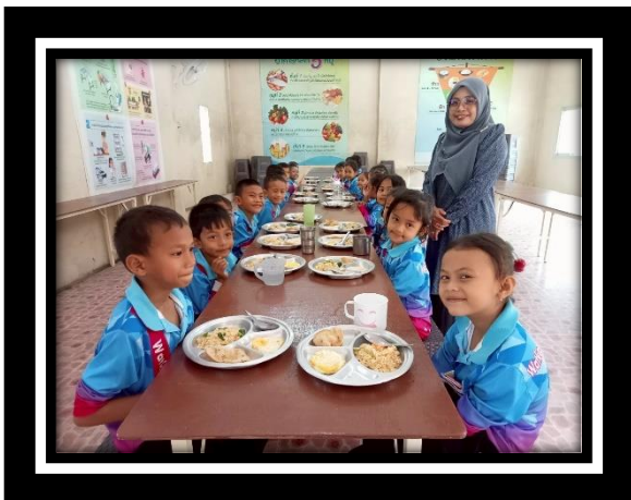
เด็กระดับอนุบาล ๒ - ๓ ดื่มนม และรับประทานอาหารกลางวันทุกวัน เพื่อส่งเสริมสุขภาพและแก้ไขปัญหภาวะทุพโภชนาการ