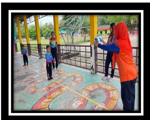
เด็กรับลูกบอลได้ด้วยมือทั้งสองข้างได้