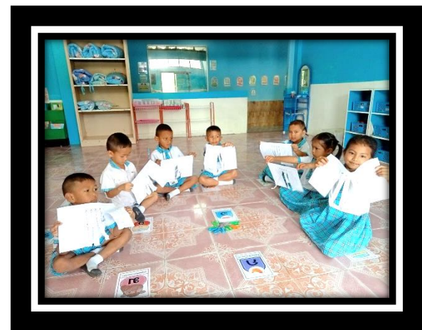
เด็กใช้กรรไกรตัดกระดาษตามแนวเส้นตรงได้