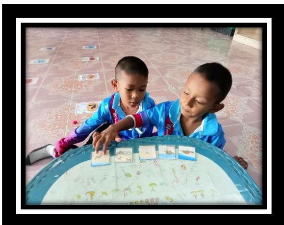
เด็กเรียงลำดับเหตุการณ์ก่อน-หลัง