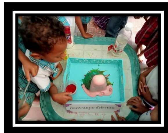
ภูเขาไฟระเบิด โดยการใส่เบกกิ้งโซดา ในน้ำที่ทำเป็นปล่องภูเขา ทำให้ให้เกิดฟองลาวาออกมา