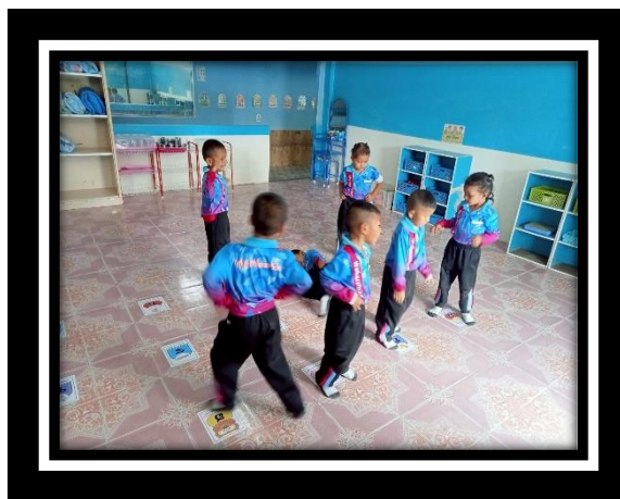
เด็กแสดงท่าทางเคลื่อนไหวประกอบเพลง