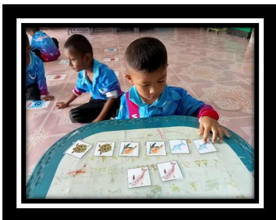
เด็กสามารถจับคู่ภาพที่เหมือนกัน