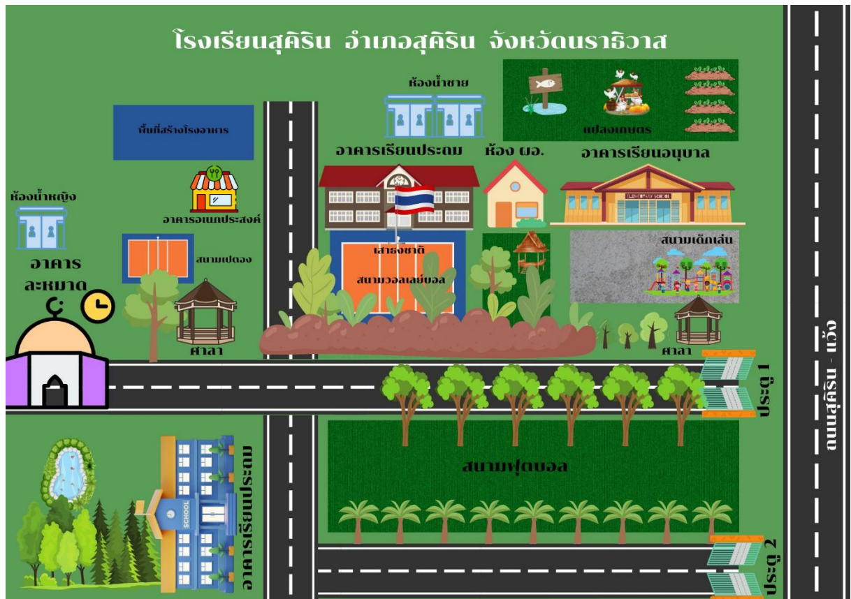
แผนผังโรงเรียนสุคีริน