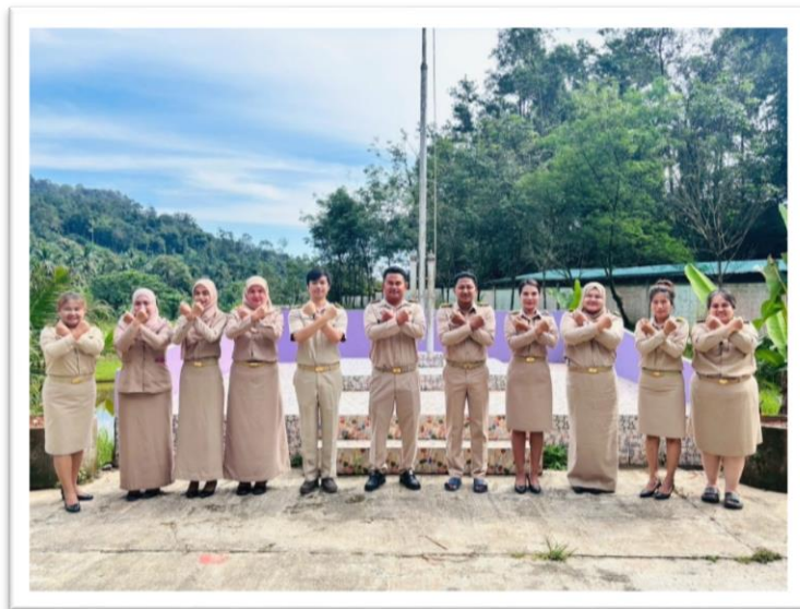
ผู้บริหาร คณะครู และนักเรียนแสดงเจตจำนงการทำงานต่อต้านการทุจริต