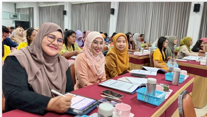
บุคลากรเข้าร่วมประชุมโรงเรียนสุจริตและการพัฒนาเว็บไซต์