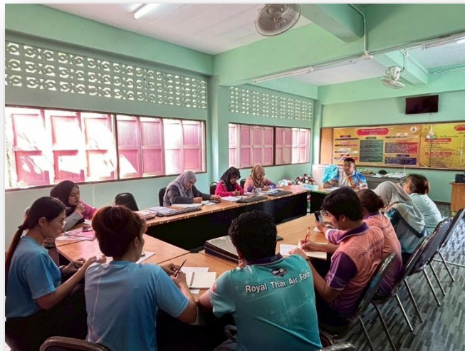
การประชุมวางแผนโรงเรียนสุจริต