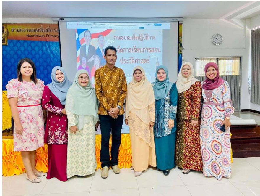
ภาพประกอบการดำเนินงานประชุม อบรมพัฒนาตนของข้าราชการครูและบุคลากรโรงเรียนเพลินพิศ